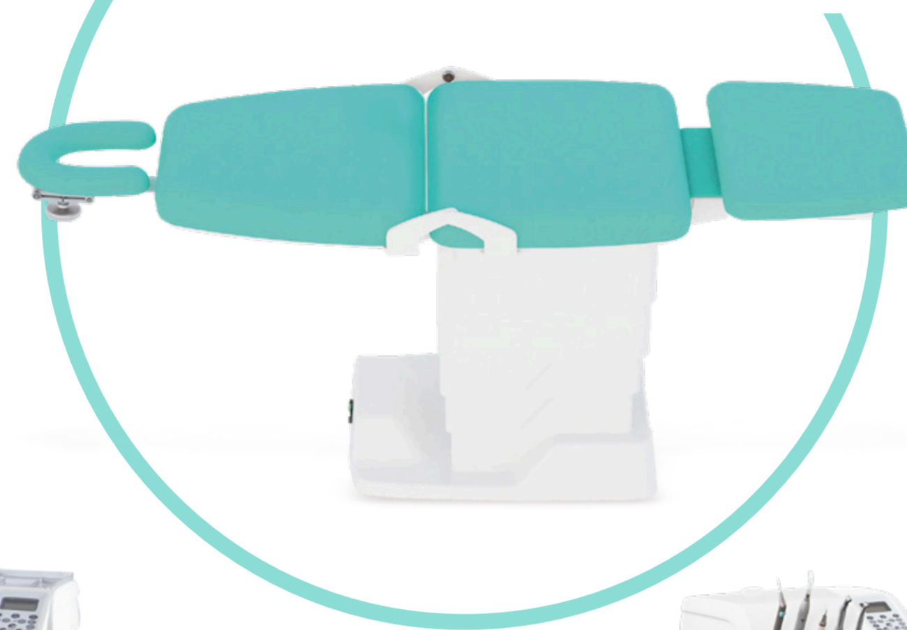
XWELL AES PARA PROCEDIMIENTOS MÉDICO-ESTÉTICOS